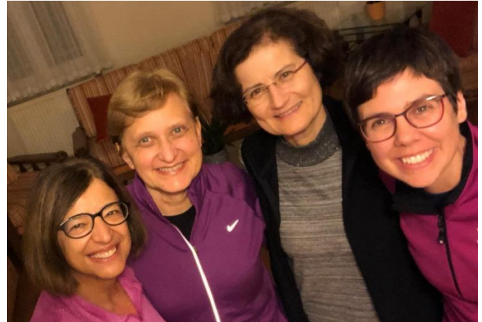
Die Frauen-Gemeinschaft der Fokolarbewegung in Istanbul

gekommen um Jesus zu lieben“. Und Er hat viele Gesichter. Die Gesichter der Menschen, die ich täglich treffe: die Fokolare, mit denen ich lebe, die Kolleg*innen, mit der ich arbeite, wem ich zufällig auf der Straße begegne, egal von welchem Land oder welcher Religion. Jesus hat es uns im Evangelium deutlich gesagt: „Was ihr für einen meiner geringsten Brüder getan habt, das habt ihr mir getan. “ (Mt 25,41)