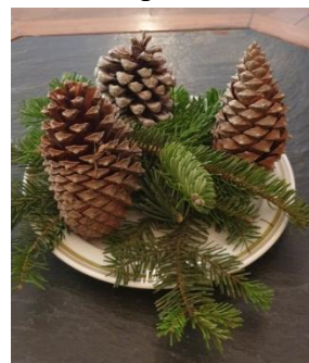
Echte türkische Zapfen beim Weihnachtsbasar in St. Paul

Auch Lidl wird in diesem Jahr zu Weihnachten nur Kiefernzapfen-Artikel aus der Türkei anbieten.