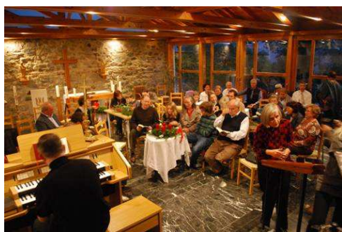
Adventsingen im Paulussaal

Am 28. November 2010, dem 1. Adventssonntag, fand am Abend bei uns das schon zur Tradition gewordene Adventsingen statt. Nach der Hl. Messe, bei der Pater Rolke die Adventskränze segnete, saßen wir gemütlich im Paulussaal beisammen und sangen zum Orgelspiel unsere schönen zu Gemühte gehenden und im ganzen deutschen Sprachraum bekannten Adventslieder.