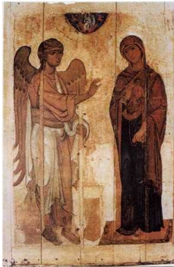
Verkündigungsszene: Maria und der Erzengel Gabriel